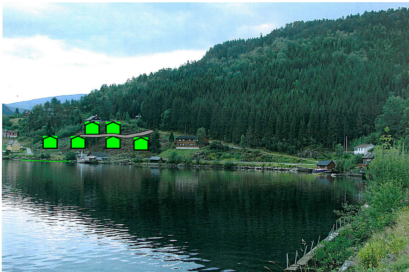
Illustrasjon/montasje av planlagt bustadfelt med tilkomst - Vombevika - Ulvik herad