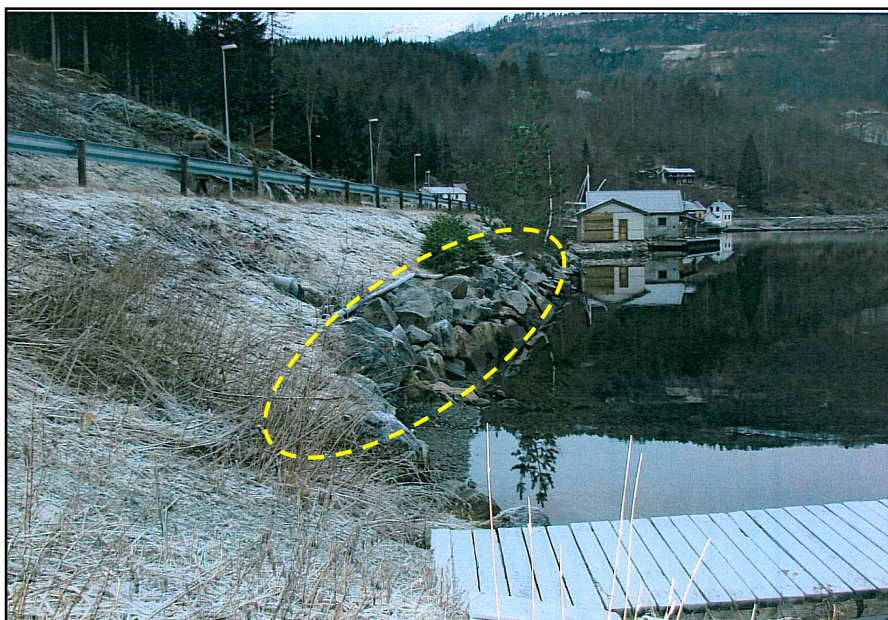
Her ynskjer ein å leggja tilrette for trygg ferdsle

På nedsida av riksvegen er det i dag eit uframkommeleg område som er eit resultat av vegfyllinga. Det er ynskjeleg å leggja til rette for bruk av området på vegfyllinga, med ein gangsti opp til eksisterande opning i autovernet. Dette kan enkelt gjerast ved å mure opp fronten på ny, og etablere ei gangsti langs denne muren. Dette vil opne området for ålmenta og det vil verta tilrettelagt slik at kryssing av riksvegen skjer på ein trygg måte.