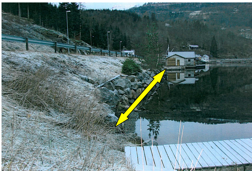
Gul pil viser omtrentleg kvar gangstien vil koma.

Gangstien er tenkt lagt på eksisterande vegskulder.